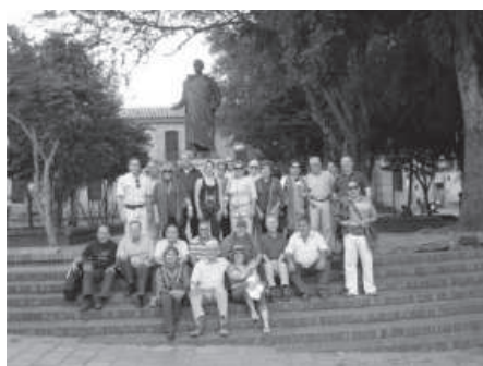
Encuentro de exalumnos Colegio José Eusebio Caro en su centenario - 1911-2011.